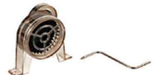
Turbina completa con tubo y tobera