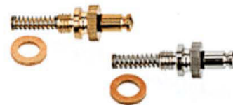
Válvula de seguridad con muelle