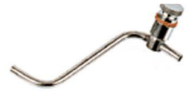
Engrasador de choro de vapor con tubo y tapón