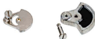
Cigüeñal con tornillo de perno