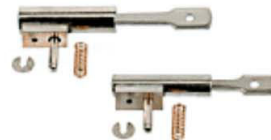
Cilindro oscilante con émbolo, vástago y muelle