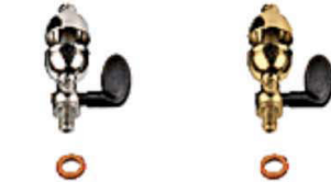
Silbato de vapor tipo campana