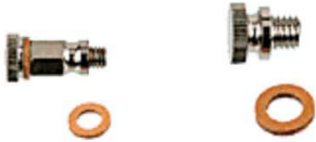
Engrasador pieza sobrepuesta completo con tapón