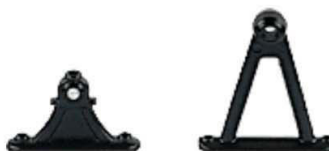
Pedestal de cojinete